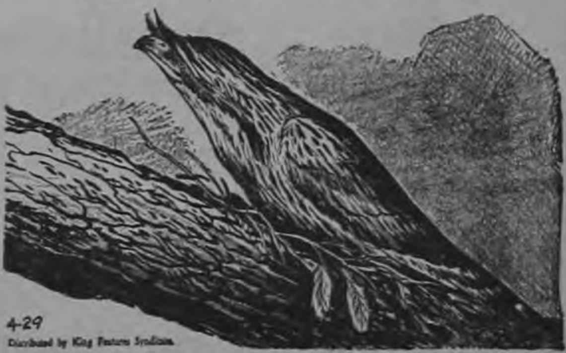
4-29 Distributed by King Features Syndicate