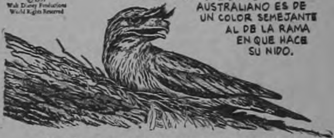
CUANDO SE ASUSTA SE INMOBILIZA EN UNA POSICIÓN QUE COMPLETA EL DISFRAZ.

AUSTRALIANO ES DE UN COLOR SEMEJANTE AL DE LA RAMA EN QUE HACE SU NIDO.