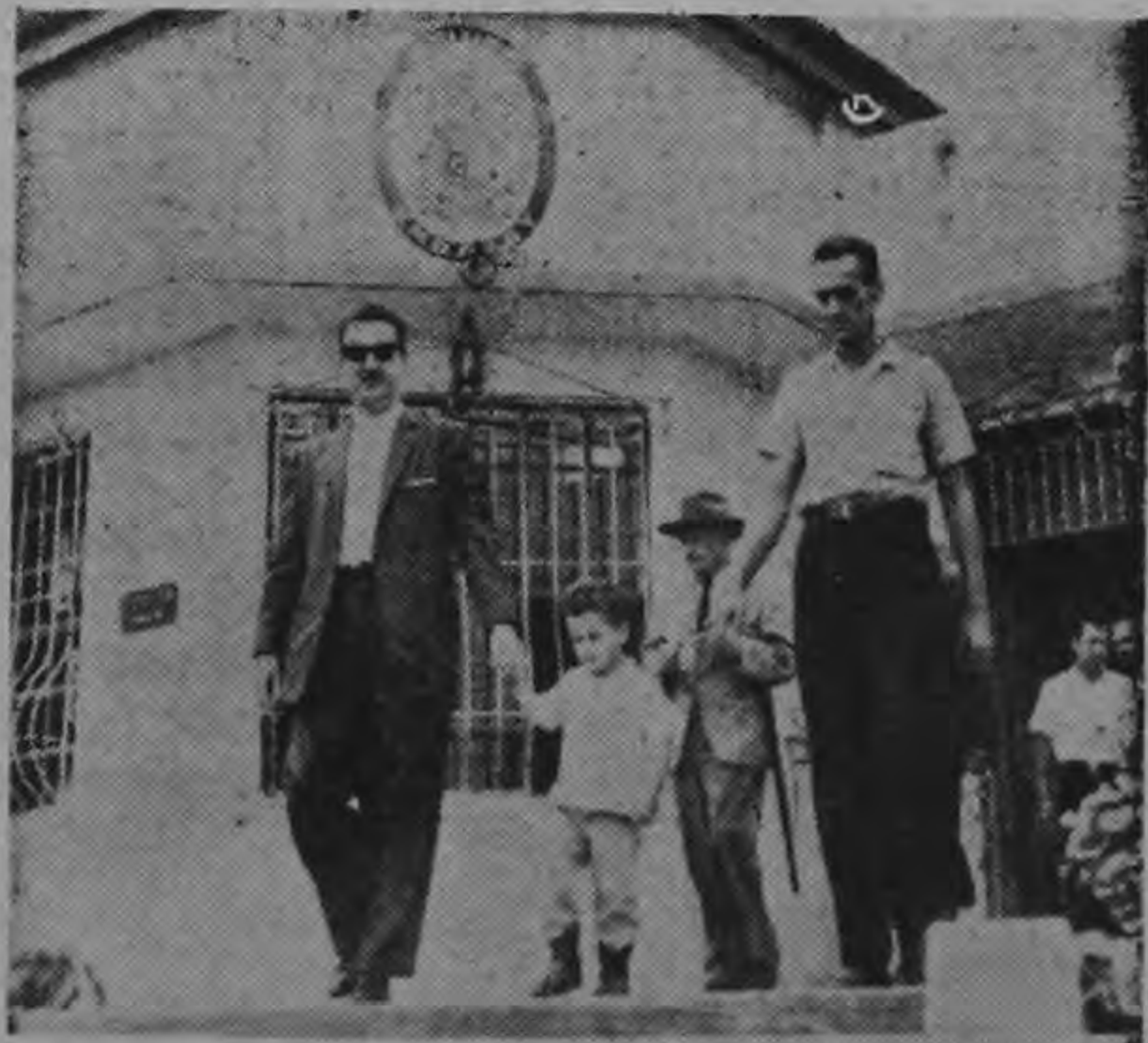
Una Comisión del "Comité de Exilados Cubanos" fue recibida en la mañana de ayer por el Encargado de negocios de la Embajada Británica, al que entregaron los exilados una instancia dirigida a SM Isabel II pidiendo interceda por la vida de sus compatriotas secuestrados por el gobierno de Fidel Castro de "Cayo Angulla", Isla de las Bahamas posesión inglesa. Durante la breve charla, los cubanos expusieron sus temores sobre la suerte de los 19 secuestrados por el castrocomunismo, ofreciendo el funcionario inglés, hacer llegar el documento al gobierno de su país, a través de los canales diplomáticos. En la "foto" cuando comenzaban a abandonar la sede de la Embajada. (Foto Solanov).