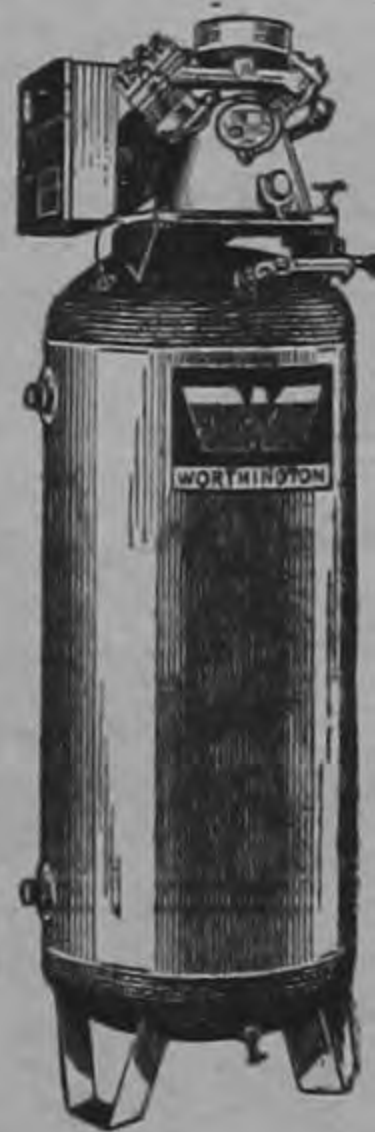
La forma en "X" del nuevo compresor Worthington reduce la vibración y aumenta la eficiencia.

Permitanos hablarle más ampliamente sobre esta maravillosa innovación en el diseño de compresores.